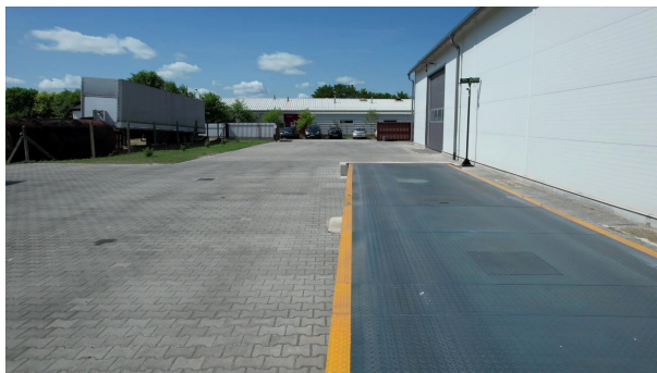
Hídmérleg, térkövezett udvar és kamionos mozgástér